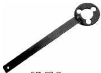
CR 97 B

Compressor de molas dianteiras p/: Escort, Verona, Apolo (de 83 a 92). Uso c/ catraca ou máquina pneumática, encaixe de 1/2". Jogo c/ 02 pcs.