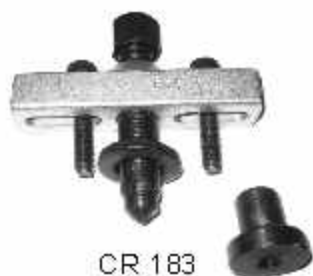
CR 183 Ferramenta para sacar a polia do virabrequim dos motores HSD MAXION 2.5 e 2.8