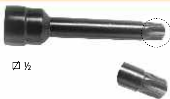
CR 124 1/2

Ferramenta para Fixação da engrenagem da bomba injetora. (Pino-Trava) S-10, Blazer, Ranger (Motor Diesel HS 2.5) MB Sprinter, Land Rover e F1000 ano 97