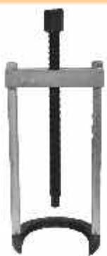
CR 166 Extrator do rolamento (90mm) do câmbio F1000 e F4000

Ferramenta para (des)montar conjunto bóia-bomba (combustível) Fiat, Stilo, Doblo, Courier e Renault