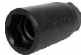
CR 152 Chave para a Porca do Amortecedor dianteiro: Golf 99 em diante, Audi / Bora Renault / Peugeot 206

Observe-se que existem no mercado 02 tipos de disco, (Roda Fônica): 1) fabricante CORTECO/FREUDENBERG (VW) - Este disco é metálico com dentes tipo engrenagem. 2) Fabricante SABÓ - Este disco é do tipo Roda Fônica magnética, por onde os sinais são emitidos.