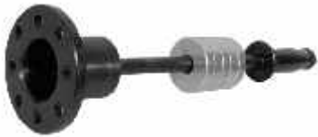
CR 139 Martelo de extração para cubo de roda dianteira VW - GM