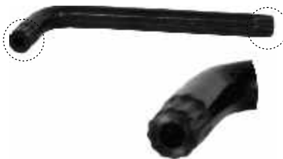
CR 160 Chave "L" multidentada de 16mm c/ guia de segurança p/ câmbio Golf e Polo