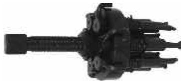
CR 167 Extrator do rolamento da 5ª marcha: Santana, Quantum, Gol, Parati, Voyage e Saveiro